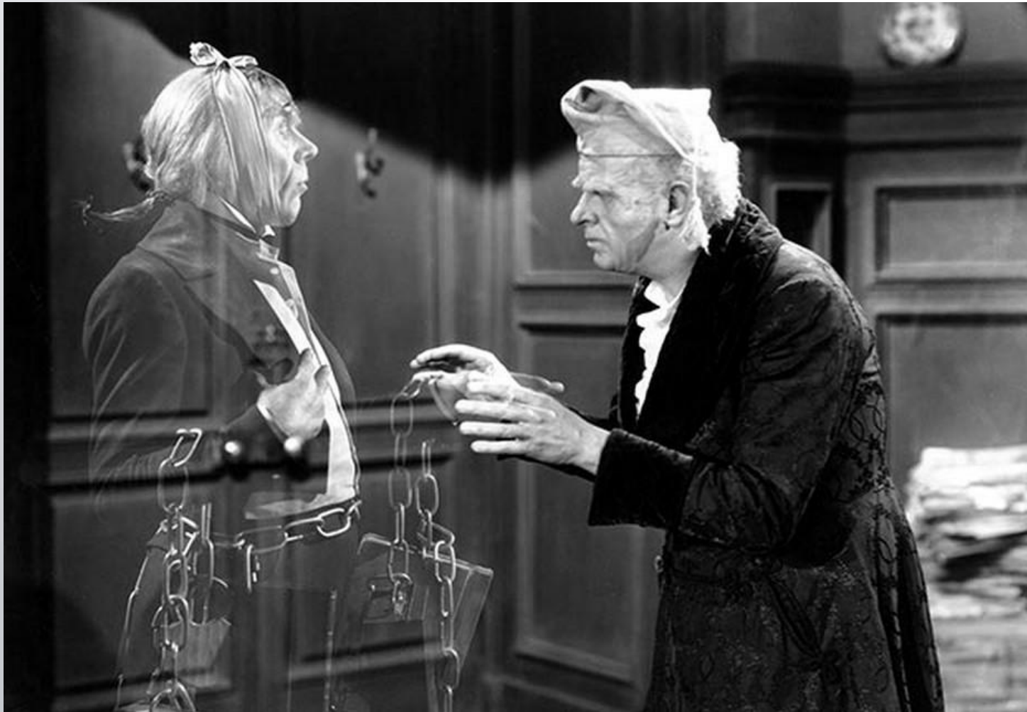
Reginald Owen, Leo G Carroll jako duch Marley'a, A Christmas Carol, produkcja Joseph L. Mankiewicz 1938, dystrybucja MGM.